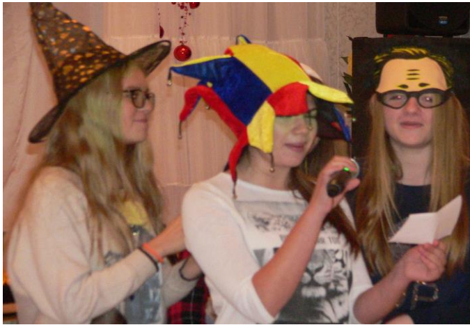
Фестиваль здорового образа «Планета встреч»