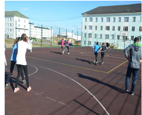
Всемирный день борьбы с курением