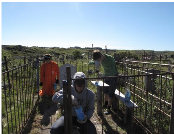
Благоустройства памятников и захоронений участников Великой Отечественной войны