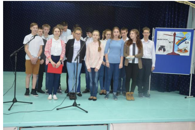
«Оставайся на линии жизни»