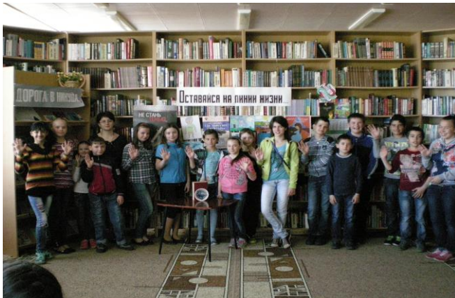
«Оставайся на линии жизни»