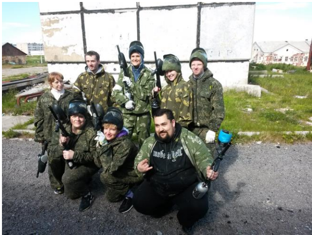
«Молодежь за здоровый образ жизни!», День молодежи