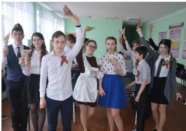
«Письма помним и чтим»