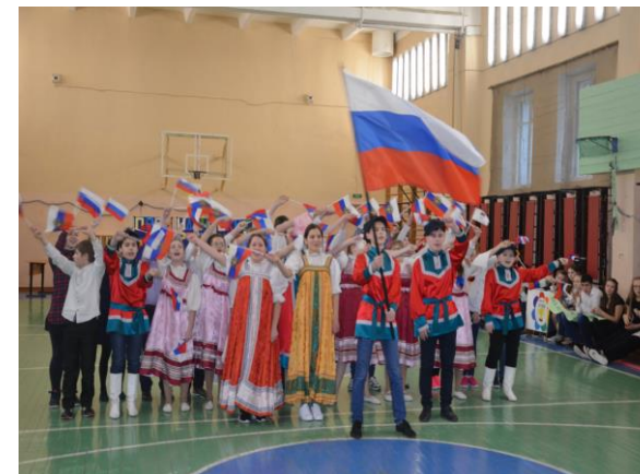
Спортивный праздник, посвященный Всемирному дню здоровья «Сегодня быть здоровым модно и престижно»