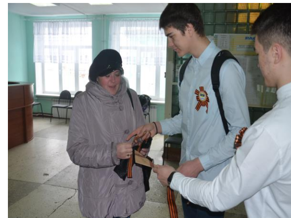
«Письма помним и чтим»