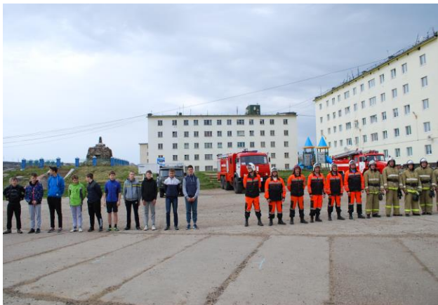
«Молодежь за здоровый образ жизни!»