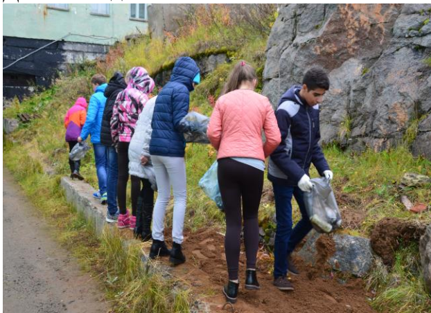
«Экология города в моих руках!»